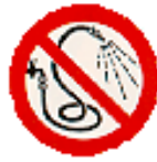
Mit Wasser spritzen verboten

In elektrischen Anlagen (Schaltanlagen, Verteilungen, Transformatorenanlagen, Datenverarbeitungsanlagen, usw.) sind vorwiegend Kohlendioxyd Löschgeräte (CO 2 -Löscher) einzusetzen.