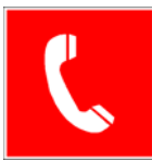
Brandmelder nach BGV A8